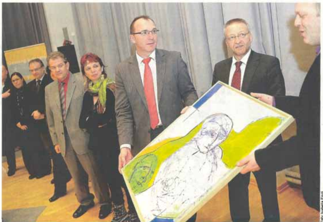
Die Verantwortlichen freuten sich über den ersten Preis

Mobilitäts-Freundlichkeit ist keine Selbstverständlichkeit. Betroffene Menschen wissen darüber ein garstig Lied zu singen, auch wenn sich in dieser Hinsicht in Luxemburg so manches bewegt hat. Abschreckende Beispiele