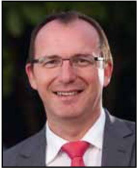
Georges Engel Bourgmestre